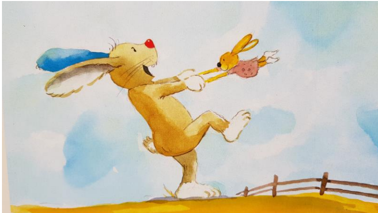
("Der Hase mit der roten Nase"; Helme Heine; Middelhauve 1987)

Es war einmal ein Hase, mit einer roten Nase und einem blauen Ohr. ... Und als der Fuchs vorbeigerannt, hat er den Hasen nicht erkannt. Da freute sich der Hase: "Wie schön ist meine Nase und auch mein blaues Ohr, das kommt so selten vor."